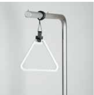
Aufrichter mit Triangelgriff